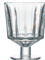
Verre à pied 6386 01 H : 11,4 cm / ø : 8,6 cm Cl : 26 / Oz : 9,17 5.40LR2.17