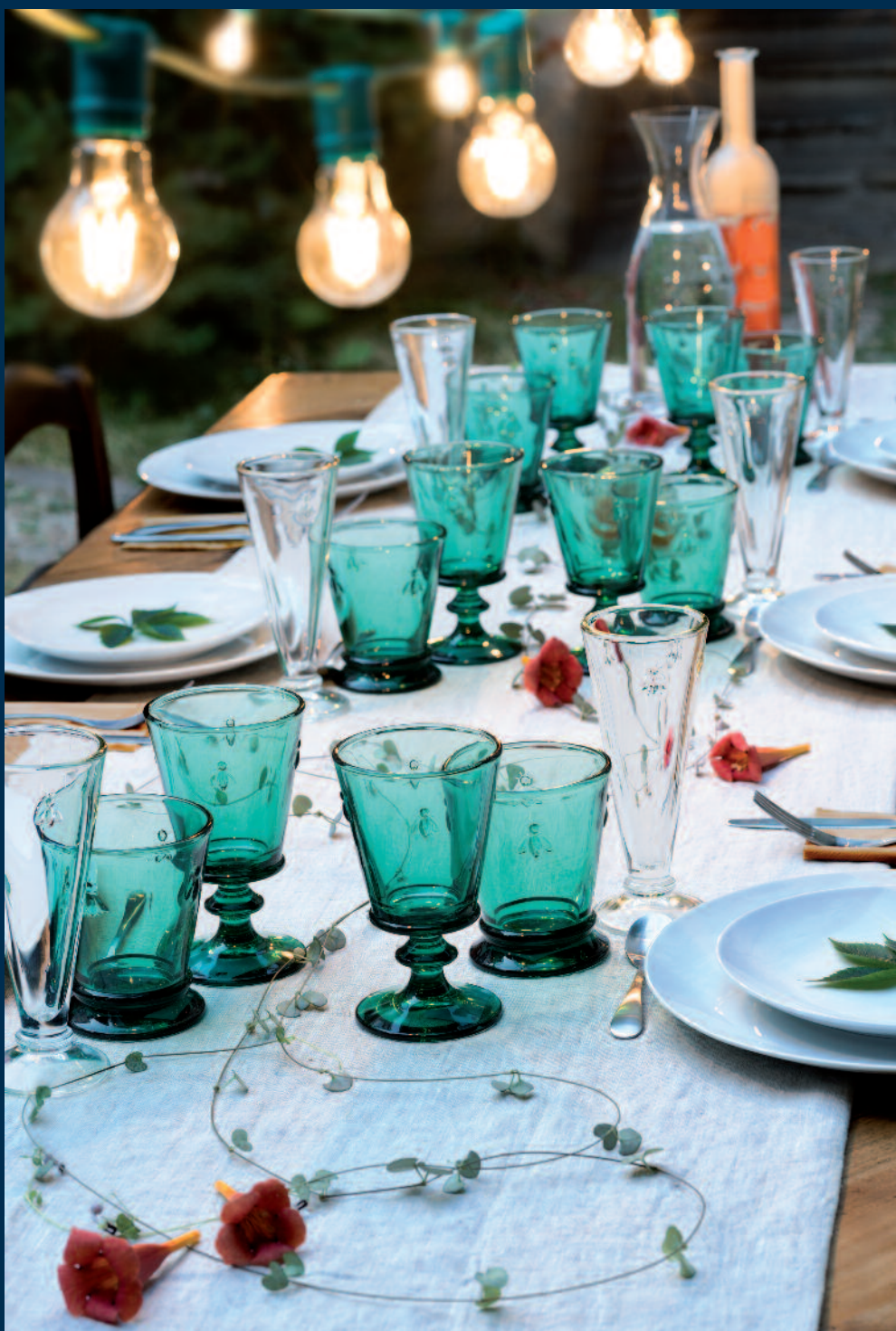
Service Abeille émeraude

Conditions générales de vente : voir les catalogues Bistrot, Invitation ou Signature 2018 La Rochère