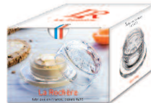
Beurrier Versailles 6403 01 H : 6,5 cm / ø : 9,5 cm Cl : 7 / Oz : 2,47 8.90LR3.60