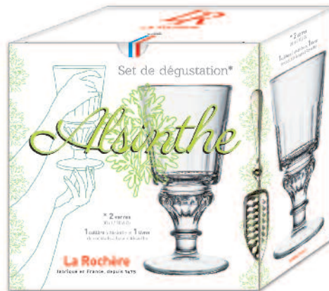
Set de dégustation Absinthe ( 2 verres, 1 cuillère et 1 livret de cocktails) 6405 01 H : 16,5 cm Cl : 30 / Oz : 10,6 25.00LR10.00