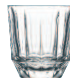
Gobelet 6387 01 H : 8,9 cm / ø : 8,4 cm Cl : 25 / Oz : 8,82 5.30LR2.11