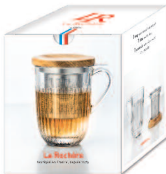
Tisanière Ouessant (1 mug, 1 filtre à thé et 1 couvercle en acacia) 6404 01 H : 13 cm / ø : 9 cm Cl : 40 / Oz : 14,11 22.00LR8.80