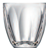
gobelet 6144 01 H : 9 cm / ø : 8,6 cm Cl : 25 / Oz : 8,82 5.40LR2.17

Designer de renom, Christian Ghion dévoile pour la première fois sa passion pour le verre en 1999 avec sa collection de vases « Inside out ». Au fil des années, il a su imposer son nom tant en France qu'à l'étranger. Fort d'une créativité affirmée et atypique, il continue à faire vibrer sa passion pour le verre.