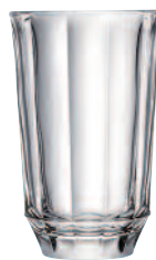
Long drink 6399 01 H : 13,3 cm / ø : 8,4 cm Cl : 37 / Oz : 13,05 5.70LR2.27